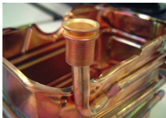
Obr.2 Mosazný přípoj na náhradním dílu - Výměník s FD > 992