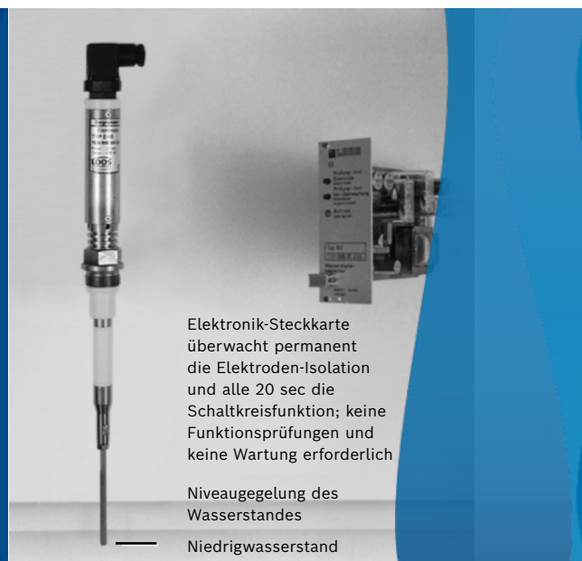
Bild 3: Zweikanalige Elektroden-Wasserstandseinrichtung – das System wird mindestens alle 6 Monate vom TÜV funktionsgeprüft