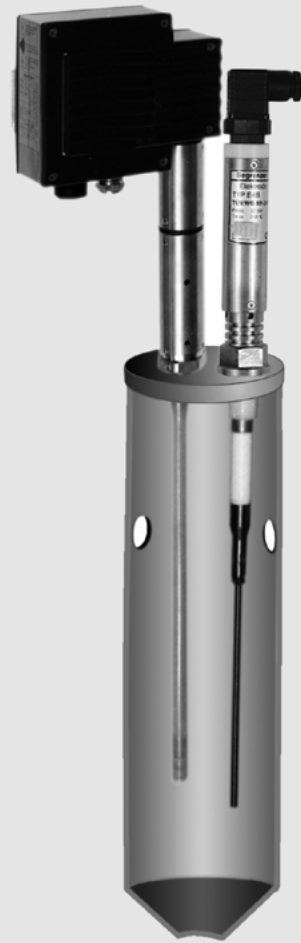
Bild 5: Elektrodensystem im Schutzrohr – Isolationsstrecke zwischen Elektroden und Schutzrohr dauerhaft gewährleistet