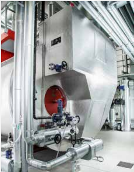
Der integrierte Economiser sorgt für höchste Effizienz.