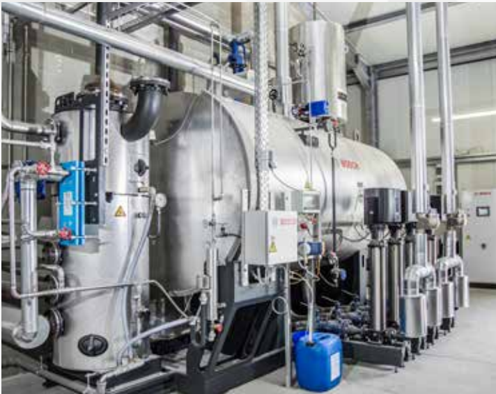
Das Wasserservicemodul mit Wärmerückgewinnung des Absalzwassers.