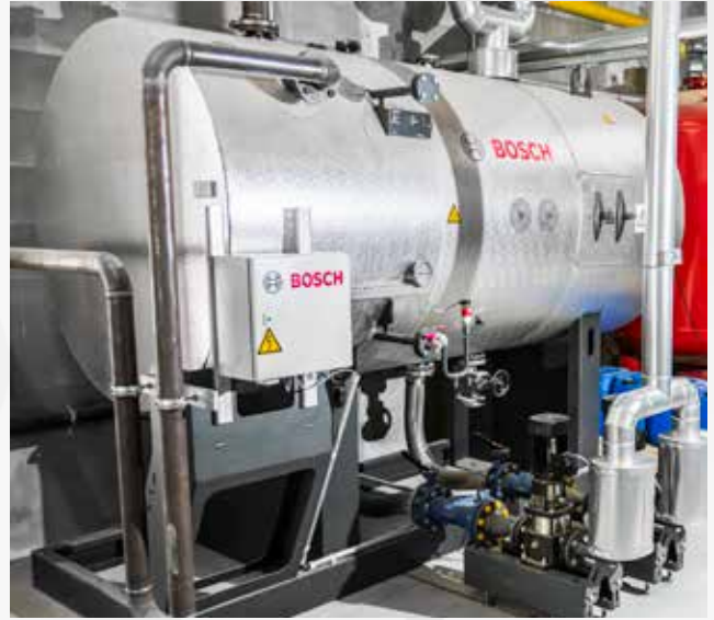
Reduzierung von Zusatzwassermengen durch das Kondensatservicemodul.

nungsluft. Im Vergleich zur mechanischen Verbundregelung bei den alten Feuerungen wird eine präzisere Einstellung erzielt und somit der Brennstoffverbrauch verringert.