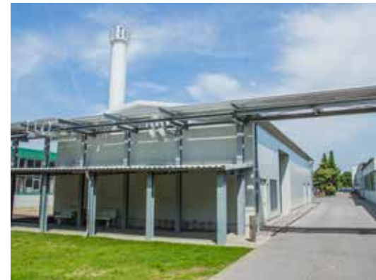
Außenansicht des Kesselhauses von Valenzi.

Bosch Industriekessel GmbH Tel.: +49 9831 56-0 info@bosch-industrial.com www.bosch-industrial.com