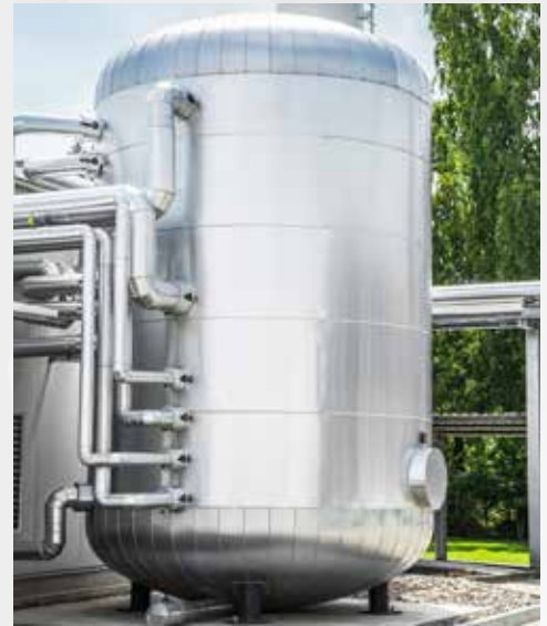
Die Abwärme der Kompressoren und Kühllhäuser wird dem Wärmespeicher zugeführt.

Während des Normalbetriebs schützen integrierte Automatikfunktionen die Kessel und die Anlage vor Korrosion, Wasserschlägen und Versalzung. Außerdem wird die mechanische Belastung besonders bei Kaltstarts minimiert. Der Kesselwärter wird von seinen umfangreichen Tätigkeiten entlastet und übernimmt lediglich noch Überwachungs- und Beaufsichtigungsfunktionen.