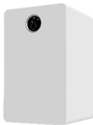
Chaudière fioul Olio Condens 2300 F

Prix de vente publics indicatifs : Olio Condens 2000 F - de 4 399 à 4 684 € TTC ; Olio Condens 2300 F - de 3 218 à 3 692,50 € TTC