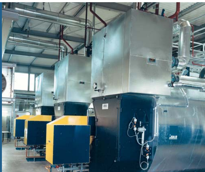
Figure 2: Exemple d'installation dans une usine de papier – 3 chaudières à vapeur avec surchauffeurs

Bosch Industriekessel s'engage à fond dans ces chaudières de grande puissance de la série UNIVERSAL ZFR. Elles sont construites selon le principe éprouvé des trois passes avec voies de gaz de chauffage séparées et pour l'exploitation illimitée en tube-foyer et équipées de deux foyers pour l'exploitation individuelle indépendante. Les