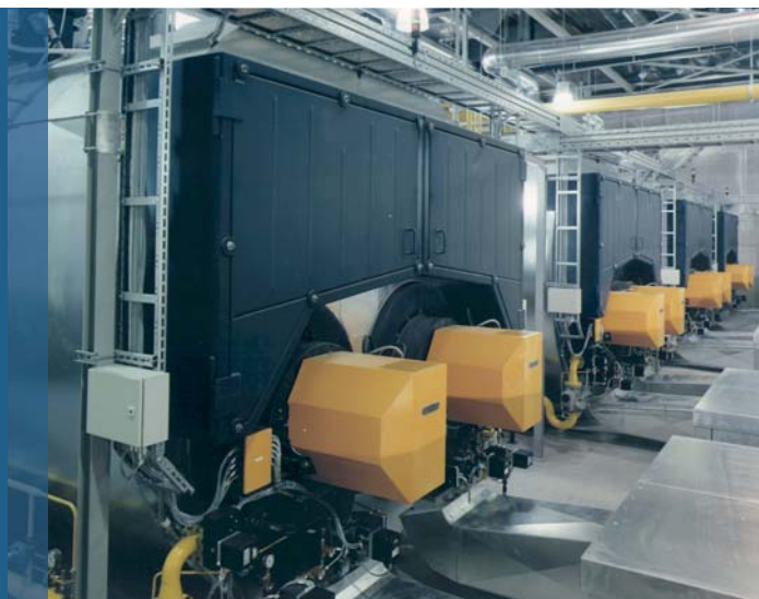
Figure 1: Photo d'installation avec 4 ZFR

Les machines à papier de la dernière génération sont conçues pour des bandes de papier de jusqu'à 10 mètres de large et pour des vitesses allant jusqu'à 2000 mètres par minute, et peuvent faire montre de leur maîtrise avec des systèmes de chaudière appropriés. Bosch Industriekessel fournit également les systèmes de chaudière appropriés avec des foyers et des commandes éprouvés pour ces machines à papier les plus modernes et les plus grandes. Ils ne nécessitent ni une construction spéciale avec des risques inconnues ni une exploitation avec une pression accrue et des pertes plus importantes. Bien dimensionnées et commandées, les chaudières de série UNIVERSAL répondent à toutes les exigences.