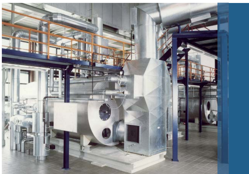
Photo 1 : Chaudière à vapeur UNIVERSAL équipée d'un ECO 1 Stand-Alone pour une puissance vapeur de 1–28 t/h.

Dans le domaine industriel, les dispositifs de production de vapeur fonctionnent au pétrole ou au gaz depuis 50 ans et cela ne va probablement pas changer pour les 50 prochaines années. En raison de réserves mondiales limitées de ces sources d'énergie et du cartel régissant la production de pétrole, on peut s'attendre à une augmentation constante du prix de l'énergie à moyen et à long terme. En Allemagne, le prix du fuel léger a presque doublé au cours de ces dernières années. Les prix du fuel et du gaz étant liés, le gaz connaît également une augmentation avec un décalage d'env. 6 mois. Seule une utilisation parcimonieuse des énergies primaires permettra d'augmenter la durée de disponibilité et retardera l'augmentation des prix.