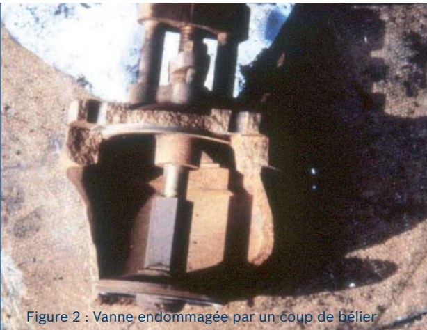
Figure 2 : Vanne endommagée par un coup de bélier