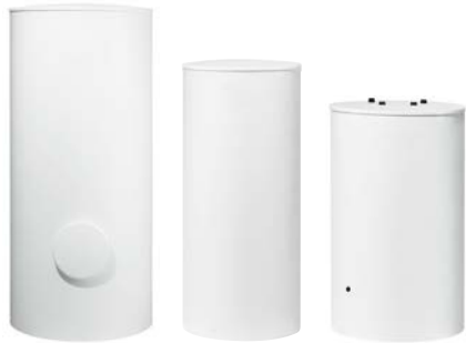
WSTB 300 C WSTB 160–200 WSTB 120 O

Бойлеры косвенного нагрева Bosch WSTB имеют внутреннее стеклокерамическое покрытие, которое обеспечивает защиту бака от коррозии и абсолютную гигиеничность приготовления ГВС. Данное покрытие было специально разработано в отделе исследований и разработок нашей компании.