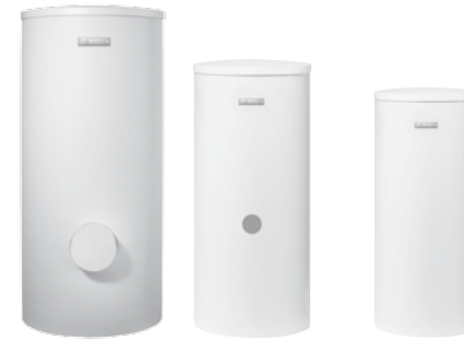
WST 300/400 WST 200–5EC WST 120/160–5C